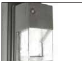
torre de luz opcional para los postes de estilo diseño potente