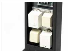
postes potente del estilo diseñador con compartimiento accesorio