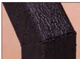
acabado de esmalte horneada para la resistencia al tiempo