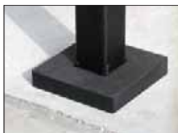
cubierta del perno de montaje en todos los estilos